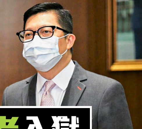
▲ 鄧炳強稱保安局去年的成就是在國家安全方面的工作。

去年接任保安局長的鄧炳強，回顧保安局過去一年的工作時表示，覺得保安局的重大成就，是在國家安全方面的工作，當中最深刻的是令不少反中亂港者銀鑰入獄。