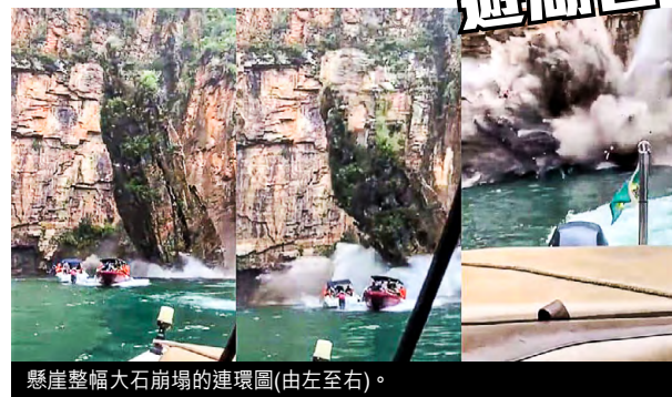
懸崖整幅大石崩場的連環圖(由左至右)。

巴西東南部一個觀光景點湖泊，有懸崖整幅大石崩塌，巨石整塊砸下擊中正在遊湖的多艘觀光船，最少7人死亡，3人失蹤，另有40人受傷。當局派出40名消防員和潛水員，並出動直升機到場搜救。