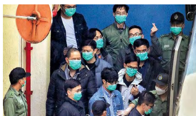
鄧炳強指，過去一年，不少反中亂港者銀鑰入獄。

2019年時接掌警務處，去年出任保安局長的鄧炳強說，當年發生的事情，其實就是「顏色革命」，期間危害國家安全的外部勢力，利用「假新聞」挑起社會不同層面群體對立，煽惑市民攻擊政府、執法部門，因此當局必須對「假新聞」採取針對性措施。他表示，民政事務局現正研究用立法或其他方法來規管「假新聞」，保安局會全力支持。