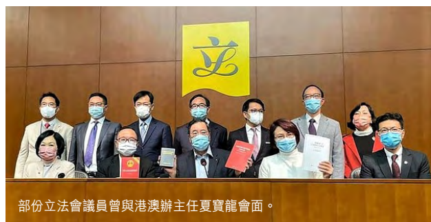
部份立法會議員與港澳辦主任夏寶龍會面。

夏寶龍又指，香港早前各種亂象越演越烈，是因為選舉制度存在漏洞，為反中亂港分子大開方便之門，而立法會過去執行紀律不嚴，導致破窗效應，情況一發不可收拾。他又指，中央真心實意在香港搞民主，但香港民主發展要符合自身實際情況，符合「一國兩制」原則，走香港特色的路，不能照搬西方一套，不能在民主幌子下成為顏色革命橋頭堡，而香港當務之急是聚焦發展經濟，改善民生。