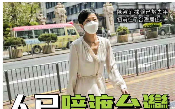
陳淑莊據報已於去年初前往了台灣居住。