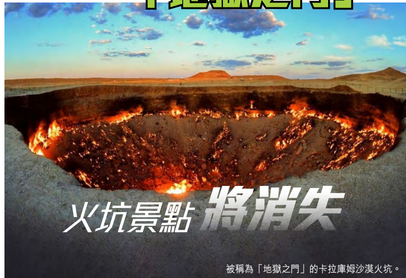
被稱為「地獄之門」的卡拉庫姆沙漠火坑。

中亞國家土庫曼的卡拉庫姆沙漠，有一個著名旅遊景點「地獄之門」，每天不停燃燒巨型地坑溢出的天然氣，持續了50年，但由於旅遊業持續不振，土庫曼總統下令政府想辦法將火勢撲滅，讓天然氣資源可更好運用。