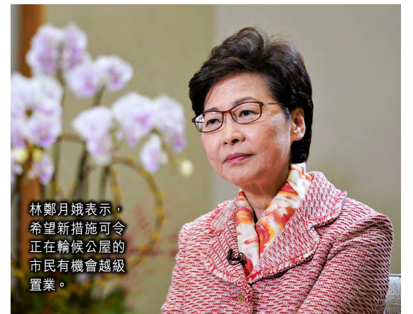
林鄭月娥表示，希望新措施可令正在輪候公屋的市民有機會越級置業。

團結香港基金土地及房屋研究主管葉文祺歡迎有關建議，認為長遠治本的方法還是增加房屋供應；又認為除降低按揭門檻外，政府及房委會可考慮改以建築成本為基礎定價，使資助出售房屋更貼近市民的負擔能力。