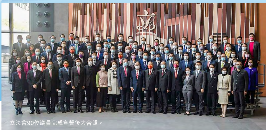
立法會90位議員完成宣誓後大合照。

本港落實完善選舉制度後首次舉行的立法會選舉圓滿結束，全體當選的90位議員，於1月3日順利完成了莊重及嚴肅的宣誓程序。本港經歷兩年前的黑暴動亂、撐暴議員搗亂憲制、合謀亂港，和新冠疫情肆虐等因素，今屆立法會議員的重要使命就更加突出，就是要本著愛國愛港的心，合力解決全港市民都極關注而在過去被長期擱置的經濟民生問題。