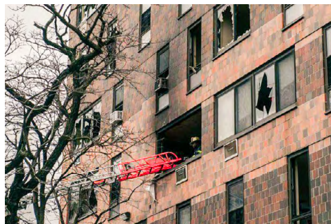
▲火警發生後，紐約派出200名消費員到場灌救。