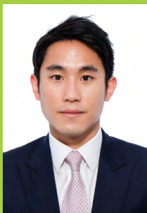
全國青聯常務委員 天津市政協委員

事實上，新一屆立法會亦必須做好配合並監察政府施政的工作，真正能夠讓經濟民生有所改善，提出實質解決的深層次矛盾的辦法，讓香港市民感受到新選舉制度所帶來的良政善治效果，這樣才能提升新選舉制度的公信力和認受性，香港市民才會真正擁抱這樣的新時代。同時，只有透過實踐落實，才能真正體驗出新選舉制度下的優越性，對我們進一步推動香港的整體發展，帶來實質的效果。