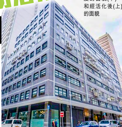
圖為永康工廠大廈的舊貌(下)，和經活化後(上)的面貌

市建局曾擬重建長沙灣永康工廠大廈，但當年因有部份業權不願接受收購，故最終須終止重建計劃。韋志成認為，面對業權分散處境的工廠單位業主，可參考市建局今次的「局部改造」執行模式，復修及改造工廠、提升設施，相信可以為其工廠物業單位增值。他透露，今次整項改造工程的支出約1.5億元，以市建局持有27個單位合共約7萬2千平方呎樓面計算，即每平方呎改造成本需要約2,000元。