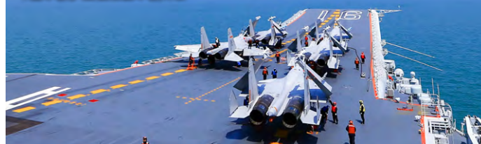
「遼寧號」艦載戰機準備升空。

而日本防衛省就表示，「遼寧艦」自本月3日起，連續6日進行艦載戰機升降。其中在「遼寧艦」與2艘導彈驅逐艦、1艘高速戰鬥支援艦，共4艘艦船一同航行；「遼寧艦」當日在石垣島以南約160公里附近，從早上約9時停留至晚上8點左右，日方正密切監察和進行分析。