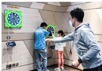
在香港飛鏢聯合總會努力下，本港的飛鏢已呈多元化發展。