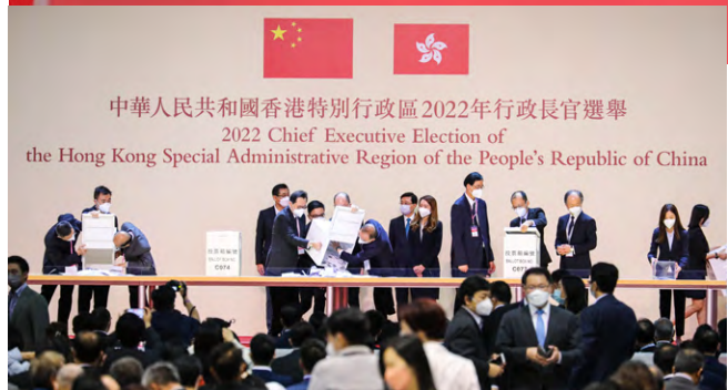
▲ 今屆特首選舉投票率為97.74%，李家超得票率是99.16%。

香港特區第六屆行政長官選舉5月8日進行投票，今屆選委會之中1461人，當中有1428名選委到場投票，即有33人未有投票，投票率為97.74%。唯一候選人李家超獲1416張支持票，當選第6任行政長官，得票率為99.16%。李家超以歷來最高得票率當選行政長官後表示，衷心感謝不論是否投票支持他的所有選委，又感謝所有支持及鼓勵他的人，亦感謝收看電視直播的市民。