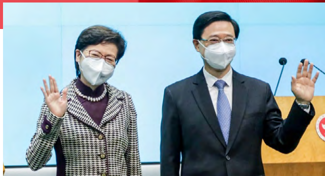
▲ 李家超（右）與林鄭月娥會晤，商討政府交接事宜。

當選行政長官的李家超發表勝選講話，指出市民最重視土地房屋問題，他會根據政綱，成立兩個由司長級官員領導的土地供應統籌組及公營房屋行動小組，其中會要求房屋小組在成立三個月內提交報告及建議。他又指，目前首要工作是組班，因為距離上任只有不足兩個月，但對組班有信心。他指本港不缺人才，而且在愛國者治港原則下，不少有心人希望貢獻，有信心可以找到很多有經驗及能力的人才。