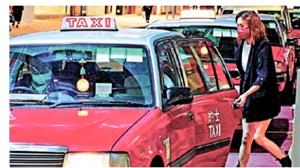
▲ 全港的士7月17日起加價。(詳刊第6頁)