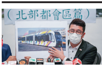
▲ 民建聯建議引進內地「智軌」列車，完善北區交通基建配套，詳刊第3頁。