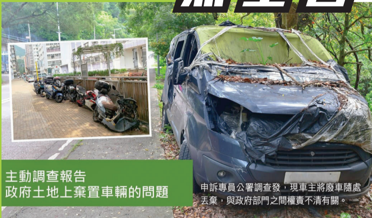
主動調查報告 政府土地上棄置車輛的問題