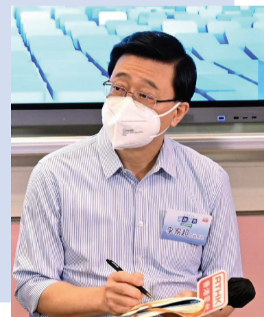
▲ 李家超細心聆聽市民發表的意見。 ▲ 特區政府就施政報告舉辦大小30場諮詢會。

在南區官立小學舉行的地區諮詢會上，李家超回應與會市民提出的意見時強調，房屋問題是重中之重，當局已成立兩個小組，希望施政報告中會給予較為實際及清晰的交代。他又指出，市民的寶貴意見，讓政府可以制訂切合社會需要的政策措施，他會積極考慮各界的意見，與管治團隊悉力以赴，回應市民的期望。