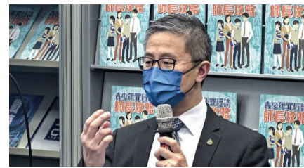
▲ 警方新學年派發《師長攻略》小冊子，促教師家長提高青少年守法意識，詳刊第6頁。