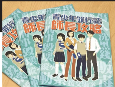
《青少年罪行誌·師長攻略》小冊子，圍繞5個主題和真實案例，提高青少年守法和保護自己的意識。

警方於新學年開始向全港超過470間中學、超過20間辦學團體和有需要的青少年服務機構，派發2萬本《青少年罪行誌·師長攻略》的小冊子，加強預防青少年犯罪工作，冀為教師、家長和市民提供防罪訊息和應對策略。