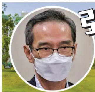
粉嶺高球場環評報告闖關失敗，環諮會主席黃遠輝被前特首梁振英強烈質疑。

粉嶺高爾夫球場粉錦公路以東32公頃用地將於明年9月歸還政府，經環境評估後，政府提出利用最北端約9公頃土地興建1.2萬個公營房屋。環諮會上月中經兩次大會逾20小時討論後，最終未有就報告作任何決定，要求當局就整體布局、生態調查、水文地理及眩光四個範疇再提交資料，預料最快明年4月才再審議。