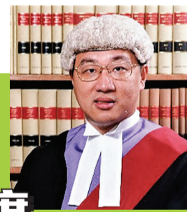
陸啟康法官獲委任為選管會主席。

行政長官委任高等法院原訟法庭法官陸啟康為選舉管理委員會主席，任期3年，由9月1日起至2025年8月31日。政府發言人說，陸啟康出任司法人員約27年，曾於不同法院及審裁處任職，經驗豐富，負責設立高等法院知識產權案件表，現時是負責該案件表的法官。