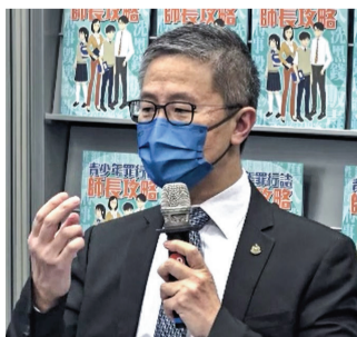
蕭澤頤表示，近年青少年守法意識有下降趨勢，希望透過短片和小冊子，讓校方向學生傳達防罪訊息。

警務處處長蕭澤頤表示，近年青少年守法意識有下降趨勢，以往警方的學校聯絡主任出席講座等傳統方式，現時未必最有效，希望透過短片等生動和多途徑，讓校方向學生傳達防罪訊息。