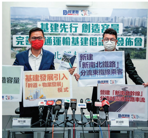
▲ 民建聯分別就新幹道規劃、新鐵路走線等提出發展北部都會區的基建和交通建