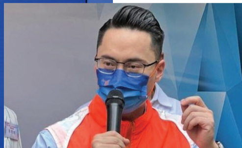
梁熙建議研究進一步縮短商務客訪港酒店檢疫，提升商務往來誘因。

身兼中央港澳工作領導小組組長的國務院副總理韓正，日前透過視像出席「一帶一路高峰論壇」，並發表演講提出「四點希望」，包括香港要繼續主動作為，拓展暢通便捷的國際聯繫，加強人文交流，支持香港繼續以多種形式參與共建國家的人文交流，擴大教育科技合作，吸引更多學生、學者赴港留學研學。