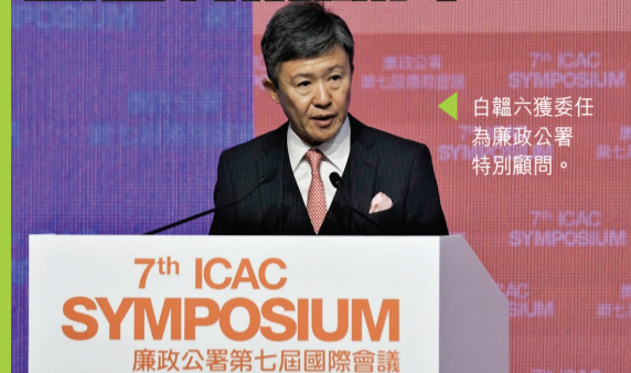
白韜六獲委任為廉政公署特別顧問。