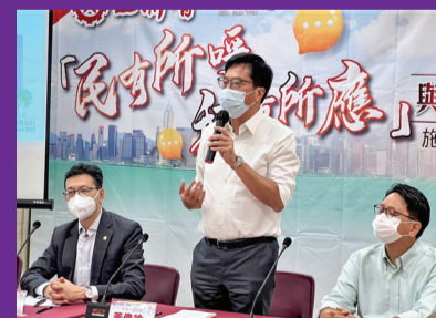
▲ 黃偉綸出席工聯會舉辦的施政報告諮詢會。

何永賢表示，政府成立了多個有關房屋政策的工作小組，目標要檢視不同的項目是否能夠按時交付，部門之間的協調能否加快等。她又提到政府目前已採用高新科技以加快建屋落成。