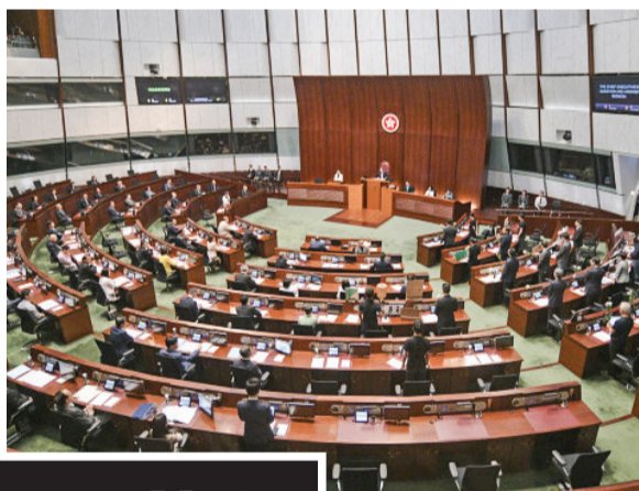
▲立法會大會通過修改《議事規則》，以配合完善選舉制度後立法會由1月開始的任期。

及行事方式，當中均沒有任何規則規管，同一議會會期內兩次全體會議之間的最長相隔時間，因此委員會建議刪除相關規定。