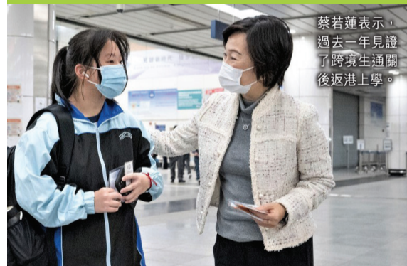
蔡若蓮表示，過去一年見證了跨境生通關後返港上學。