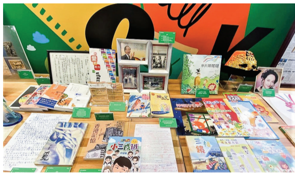
▲ 今年書展的主題是「兒童及青少年文學」

第33屆香港書展本月19至25日在灣仔會展舉行，今年的主題是「兒童及青少年文學」，有超過600項文化活動，包括作家講座及文化表演等，同期亦有運動消閒博覽及零食博覽，主辦機構貿發局預料有約760個來自30多個國家及地區的展商參與。