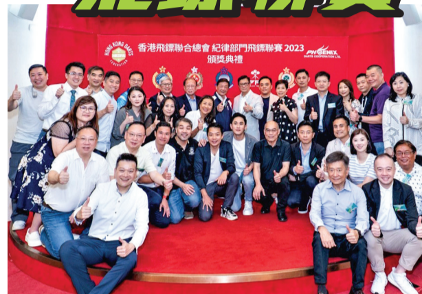
▲ 出席嘉賓進行大合照。

香港飛鏢聯合總會7月8日晚假界限街警察體育遊樂會舉行香港紀律部門飛鏢聯賽2023頒獎典禮。自今年3月初舉行聯賽的啟動禮及首站比賽後，各紀律部門的飛鏢隊一直在比賽中鬥得難分難解，當晚的頒獎禮，為整個聯賽劃上圓滿句號。