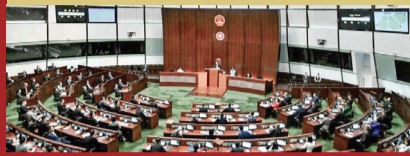
▲ 立法會連續兩日辯論區議會條例修訂草案，至少78名議員發言。