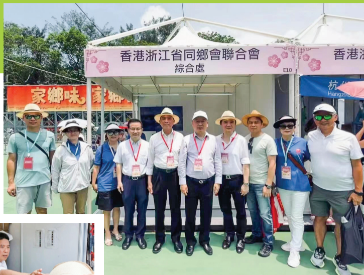
▲ 浙聯會領導參加嘉年華活動。

香港浙江省同鄉會聯合會積極參與，11個地級市為香港市民準備了不同的家鄉特色食品和工藝品，很多產品熱賣，攤位前人頭湧湧，很快貨物一掃而空，浙聯會義工們表示可以為在港鄉親和香港市民謀福祉，為在新時代擔當好兩地交流的橋樑作用出一份力，即使烈日炎炎，汗流浹背也是非常值得付出的。