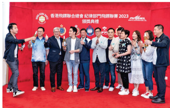
▲ 主禮嘉賓進行祝酒儀式。

參加今屆賽事的5支紀律部門包括懲教署、消防處、入境事務處、香港警務處(包括香港輔助警察隊)和香港海關，各支隊伍由3月份起，經過雙循環比賽，最終由懲教署勇奪金杯賽冠軍。