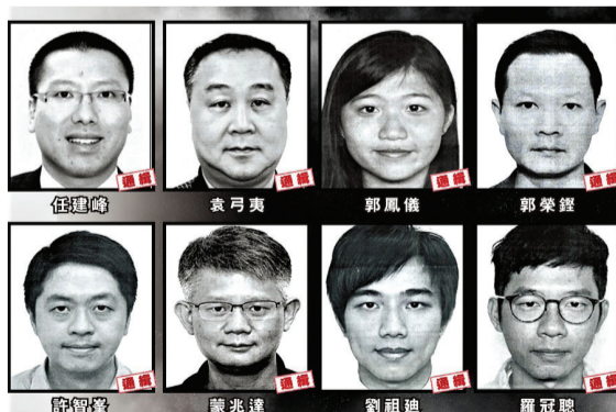
▲ 警務處國家安全處發出拘捕令，懸紅各100萬元通緝8名正處身海外的港人。

保安局又指，英國、美國和澳洲等多國，自身的國家安全法律都具備域外效力，質疑有國家無視這項原則，一次又一次肆意和無理批評抹黑《港區國安法》的域外效力，以及警方的行動，顯然是帶有雙重標準的典型操作。