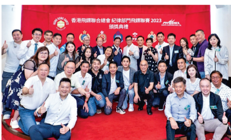
▲ 香港飛鏢聯合總會與紀律部門飛鏢聯賽，懲教署組隊勇奪金杯獎。詳刊第七版。