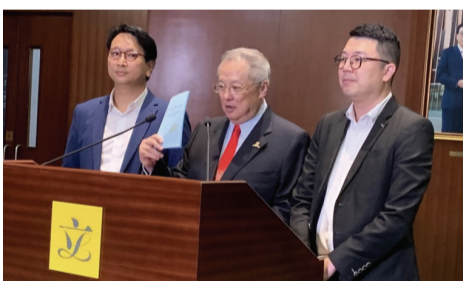
▲ 三名中大校董議員齊發功，提法案促中大校董會改組。詳刊第三版。