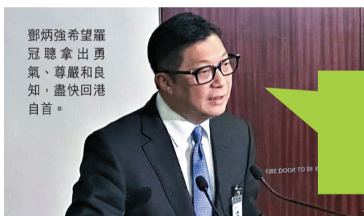
鄧炳強希望羅冠聰拿出勇氣、尊嚴和良知，盡快回港自首。

本港由治及興，離不開港人的團結，以及在經濟生產上共同努力，雖然今年國際上整體的經濟發展形勢不容樂觀，但本港有前景無限的大灣區機遇，及搭上國家的經濟發展快車，前路是光明的。正如特首李家超說，去年本港經濟收縮約3.5%，今年第1季上升2.7%，相信第3季應該比第2季更好，有信心今年應該正增長，現在評估應可達3.5%到5.5%。