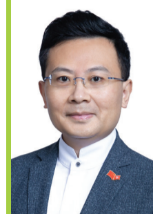
港區全國人大代表召集人 立法會議員 民建聯副主席 新社聯會長 陳勇

總言之，在《基本法》和國家安全的原則下，特區政府能針對性地提出地區行政改革，完善區議會的組成方法，不單令政府更有效策劃地區服務，更能提升市民的幸福感和凝聚民心。國家主席習近平在出席慶祝香港回歸祖國25周年大會及為現屆政府監誓時，對香港寄予厚望。盼望社會各界都能齊心完善地區治理安排，呼應國家「以人民為中心」的執政理念，做到「幼有所育、學有所教、勞有所得、病有所醫、老有所養、住有所居、弱有所扶」。