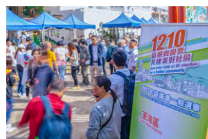
港澳辦和中聯辦發聲明，祝賀香港區議會選舉成功舉行。

駐港國家安全公署亦發表聲明，指出本次選舉徹底擺脫了過往區議會選舉亂象，告別了對抗撕裂的惡性競爭，營造出理性建設的選舉文化。選舉結果充分表明，不斷完善「一國兩制」制度體系，有國安法治為特區民主發展重回正軌保護護航，香港正在走出「泛政治化泥沼」，全社會達成安定團結最大共識。