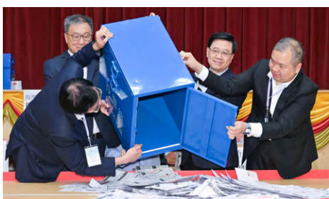
▲ 區議會選舉圓滿結束，有接近120萬人投票。詳刊第三版。