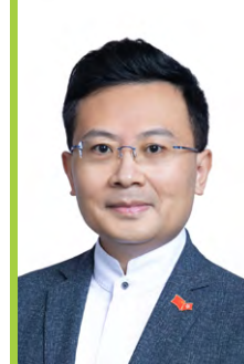
港區全國人大代表 立法會議員 民建聯副主席 新社聯會長 陳勇

2024年，是香港再創輝煌新局面的關鍵期，習近平主席一直心繫香港，「由治及興」是他對香港的殷切期盼，也是普羅市民熱切追求的目標。只要我們堅定不移和國家站在同一陣線謀求發展，只要我們熱愛香港、甘心樂意為香港奮力付出，香港定能在良好勢頭下轉危為機，開拓由治及興新局面，建設更美好的家園。