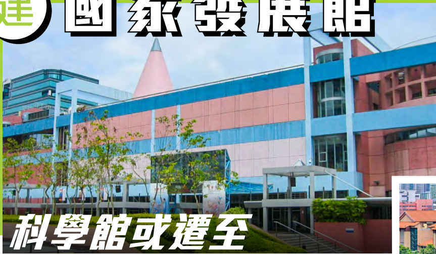
◀ 香港科學館現址，將會興建國家發展博物館。