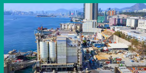
▲ 有議員指出，油塘工業區已劃成綜合發展區，但區內有水泥廠與民居有衝突，作為積極有為的政府，可以考慮進行收地，積極地推行整合的改建。

立法會研究與海濱相關的政策事宜小組委員會早前開會，討論維港兩岸臨海用地的用途，以及與毗鄰用地結合發展成旅遊景點的可行性。議員普遍支持政府提出建設及發展海濱用地的建議，並讚賞部分工作具突破性。但有議員提出希望改善海濱的连接性，議員林筱魯指出，東九龍油塘綜合發展區內，一些由原工業區一直開辦至今的設施，例如水泥廠仍然運作，與鄰近民居時有衝突，政府理論上可以更積極地處理，例如考慮收回土地，作適當的用途。