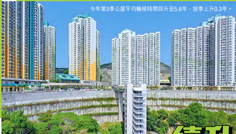
今年第3季公屋平均輪候時間回升至5.6年，按季上升0.3年。