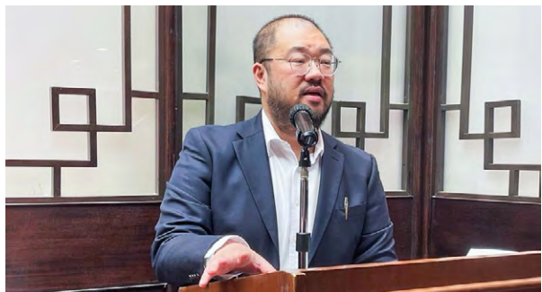
▲ 許慎教授指出，油塘區內的混凝土廠若能有序遷出，對房屋供應，居民訴求和業界都有好處