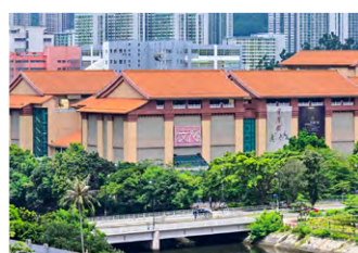
▼ 沙田的文化博物館將重建成更大型的科學館。