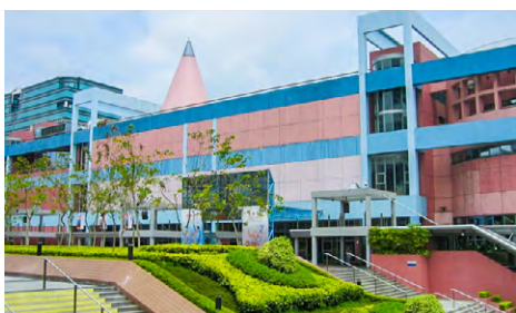
▲ 香港科學館現址，或將興建國家發展博物館。詳刊第七版。