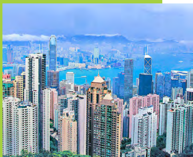
▲ 政府據修訂法例，以刊登續期公告的方式，為多達約30萬份的地契續期。

政府向立法會提交《政府租契續期條例草案》，建議以刊登憲報方式，為2025年起到期的地契續期，而刊登續期公告的時間會由原先建議的三年，延長至六年，即2031年到期的地契，續期公告不遲於2024年年底刊登。相關的條例草案已刊憲，並正式在立法會進行首讀及二讀，當局期望法例於明年中通過。