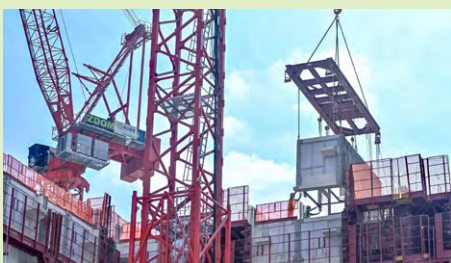
▲ 隨著大量公屋2025年陸續落成，輪候時間應會持續改善。

署方表示，公屋平均輪候時間6年封頂目標不變，公屋綜合輪候時間亦會在2026至2027年度，回落到4.5年。署方又指，直至《長遠房屋策略》的第二個5年期，傳統公屋供應量會進一步大幅增加，形容目前輪候時間的短期上升，只是轉勢前的必經階段。