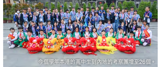
今個學年本港的高中生到內地的考察團增至26個。

今個學年本港的高中生到內地的考察團增至26個，當中一天團的行程由8個大幅減少至3個。在立法會教育事務委員會舉行會議上，民建聯立法會議員郭玲麗表示，考察團讓高中生加強身份認同及提升國民意識，又建議行程加入「紅色之旅」及國潮文化的元素。教育局局長蔡若蓮表示，不少行程涉及革命先烈的足跡，也有他們的故事或故居，學生經過時有機會接觸到。