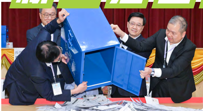
▲ 今屆區議會「地方選區」選舉，有接近120萬人投票。

李家超表示，新一屆區議員將會由來自不同背景、界別、階層、專業的人士組成，令地區工作更立體、更多角度考慮，更符合不同市民的切身利益。